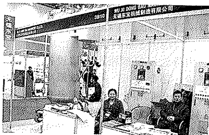
东宝展出染整系列技术。

东宝机械位于无锡前洲工业园，为满足市场需求，公司新建了6000平方米厂房和办公楼，预计8、9月投入使用。新建产能服务于国内以及东南亚、印尼、巴基斯坦、柬埔寨等地。