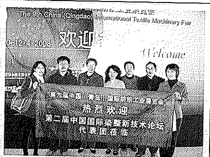
第二届中国国际染整新技术论坛代表前往参观青岛展。